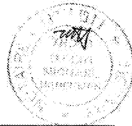
חותם הנוטריון Notary's Seal