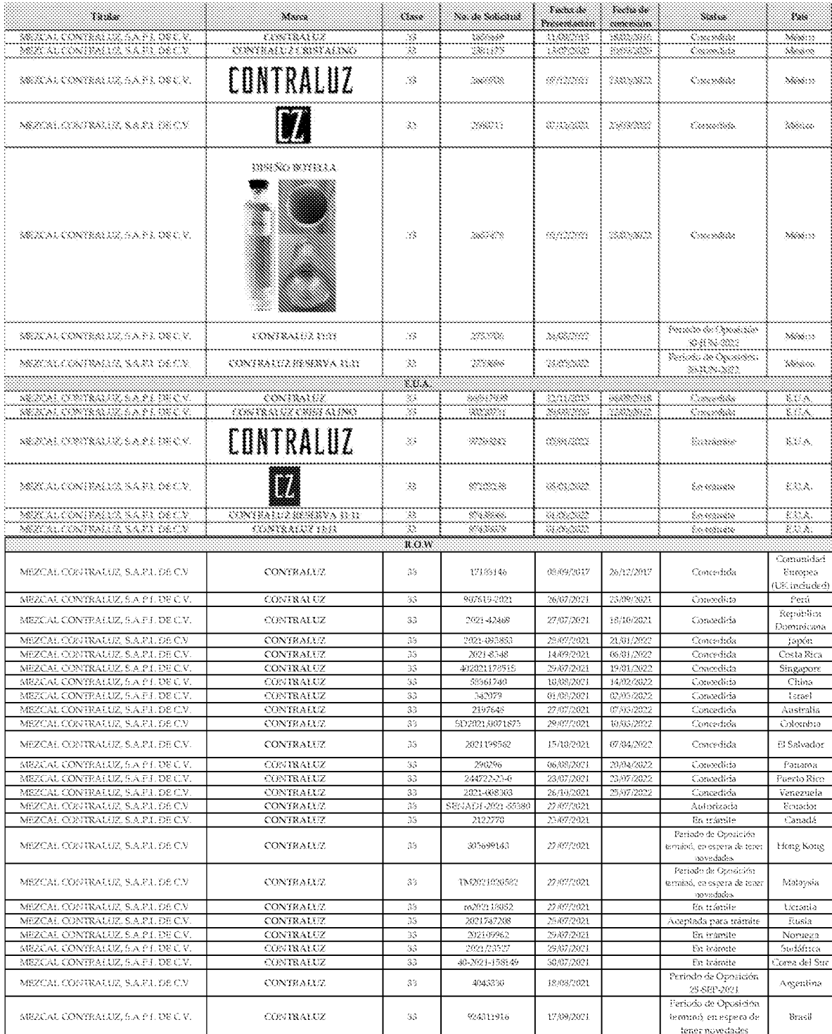
EXHIBIT 1/ ANEXO 1